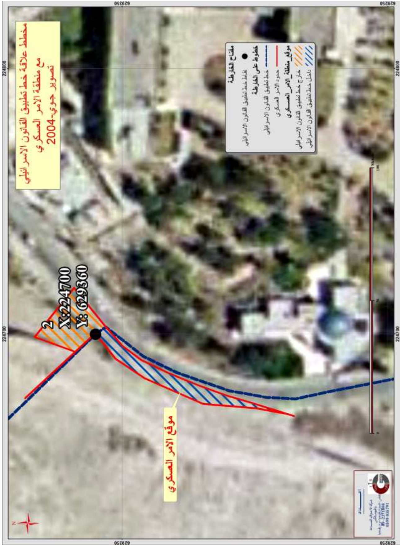
(مرفق رقم (2): مخطط علاقة خط تطبيق القانون الاسرائيلي مع منطقة الامر العسكري)